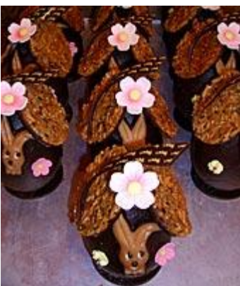
Präsent -Eier in feinschmelzender Schokolade und feinblättrigen Krokant

Überraschen Sie ihre Freunde und Bekannte